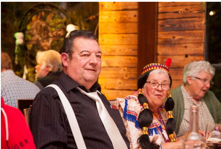
Zo zit de laatste rit van het jaar er op. Wij kijken alvast uit naar volgend jaar en er werd ons beloofd dat we met Halloween met de trein meerijden in Goes....meer moet ik niet schrijven zeker.